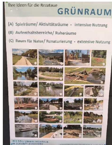
Bild rechts: Beispielfotos als Ideengeber Bilder unten: Entwürfe aus der Gruppenarbeit

Die Teilnehmer wurden gebeten Vertreter der jeweiligen Gruppen zu benennen, die ihre Entwürfe im Bauausschuss/ Stadtrat vorstellen.