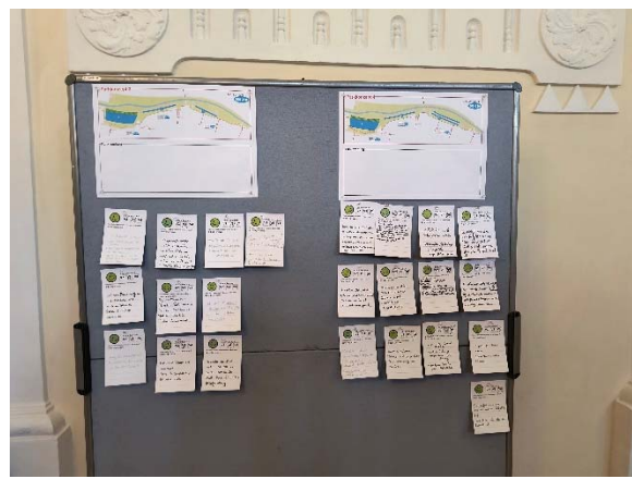
Bewertungskarten Parkkonzept Bild links: Varianten 1 und 2 Bild rechts: Varianten 3 und 4

Die von den Teilnehmern genannten Gründe und Anmerkungen wurden nach Themen sortiert und finden sich in nachfolgender Zusammenstellung: